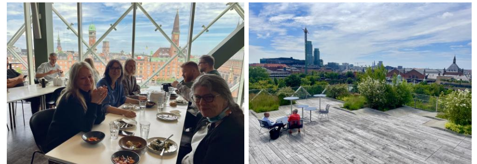
Konsulenter fra alle tre områder har fundet et fælles bord i kantinen (tv). Fælles terrasse til uformelle møder og udendørs frokost (th).

Selvom vi vil være fagligt stærke og gøre en forskel for sektoren, betyder det relationelle meget for os – vores arbejde er integreret i hinandens, og matchet skal være langvarigt for at være godt. De fleste cykler til arbejde, nogle tager Metro til Rådhuspladsen, mens andre tager tog til Hovedbanen.